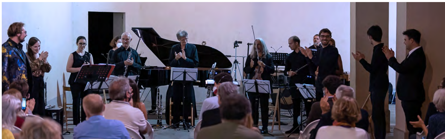
Moncalvo 2020, Piazza Carlo Alberto - Concerto conclusivo del Corso di direzione

Ingresso intero: € 5 Ridotto studenti: € 1 Prenotazione obbligatoria all'indirizzo: info@divertimentoensemble.it