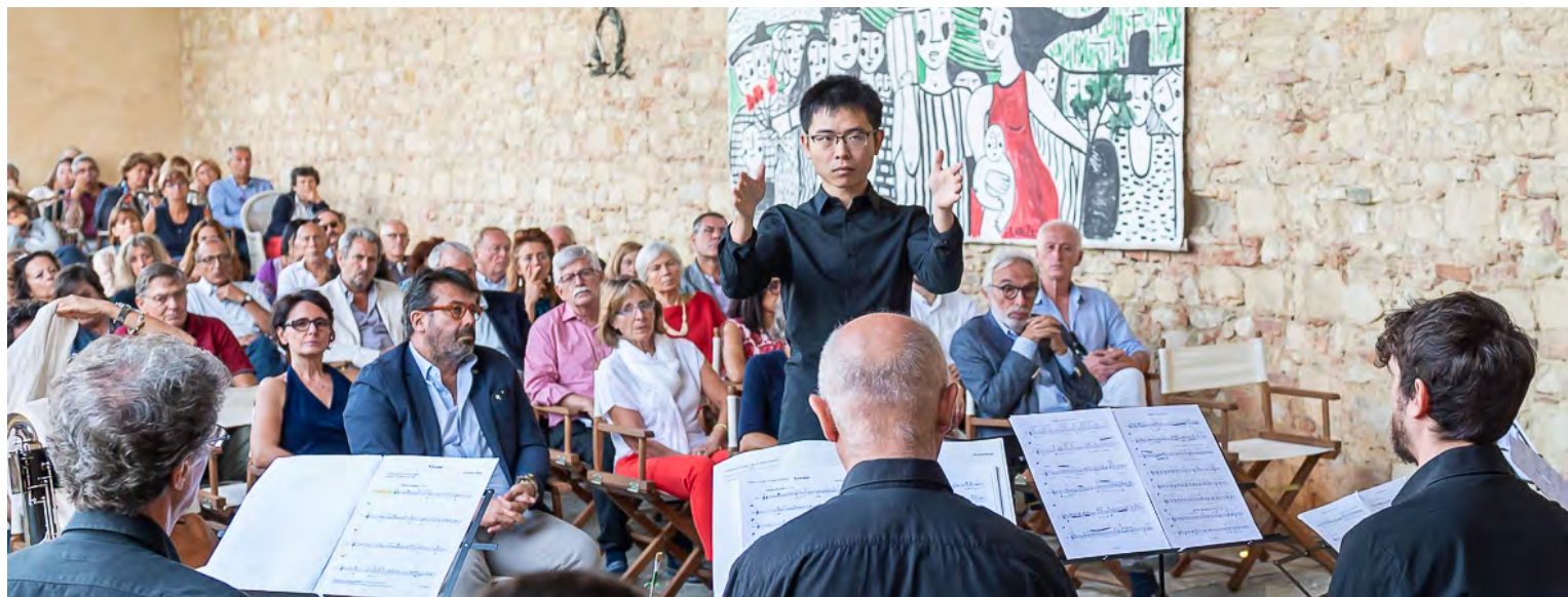
Tenuta Santa Caterina 2019 - Concerto conclusivo del Corso di direzione

proprio distintivo carattere e personalità. I giardini all'italiana e la cantinastorica completano il percorso sensoriale. Per chi si addentra nel cuore della Tenuta troverà l'Infernotto, cantina ipogea scavata nel tufo a 17 m di profondità, riconosciuto Patrimonio UNESCO in Monferrato. Un luogo d'elezione per i wine lovers alla ricerca di nuove emozioni, un'occasione da non perdere per chi è curioso di conoscere questo patrimonio della nostra agricoltura, facile da trasformare in esperienza diretta con una degustazione guidata. Annesso alla cantina storica si trova il Relais di Tenuta Santa Caterina, affacciato su grandi spazi esterni per piacevoli passeggiate lungo sentieri aperti tra siepi fiorite ed erbe aromatiche. Un servizio di breakfast realizzato con prodotti del territorio, famoso per la ricchezza gastronomica e le memorie storiche. Ampi ed eleganti spazi in comune, salotti, sala lettura, sei suites, ciascuna dedicata ad un vino della Tenuta.