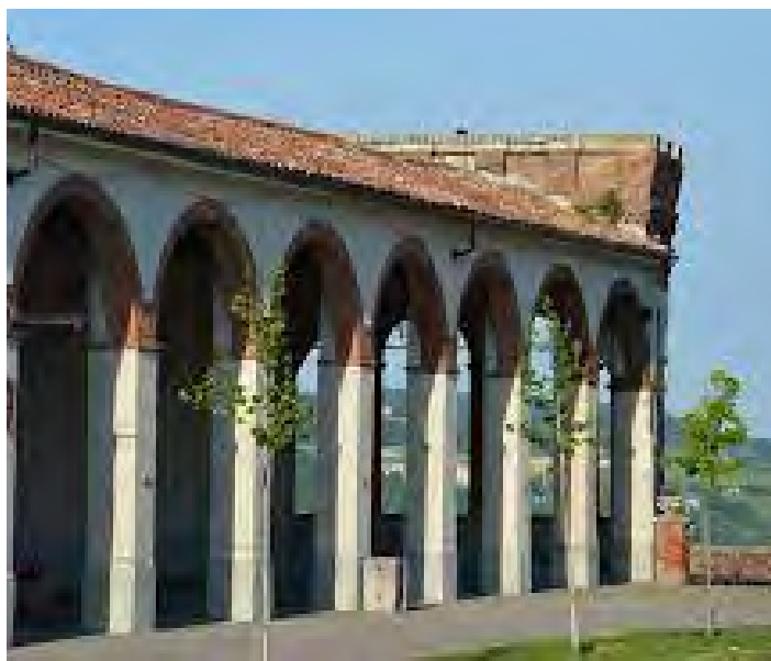
Torre e camminamenti del Castello di Moncalvo