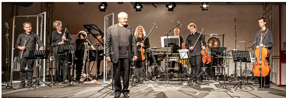
Milano 2020 - concerto conclusivo dell' International Workshop for Young Composers

Ingresso intero: € 5 Ridotto studenti: € 1 Per chi acquisti i biglietti per entrambi i concerti, ingresso al secondo concerto: € 1 Prenotazione obbligatoria all'indirizzo: info@divertimentoensemble.it